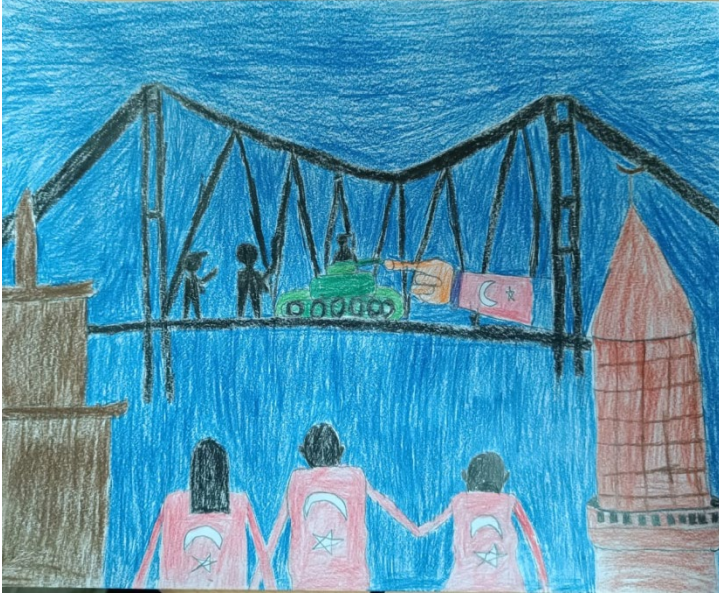
ZEYNEP KAYA 7/K