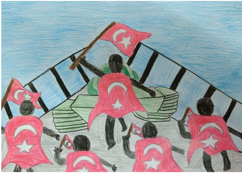
SULTAN YELİZ 7/D